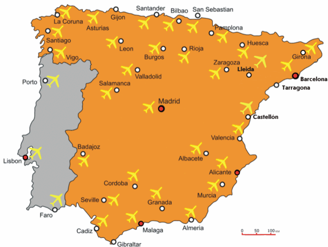
КАРТА-СХЕМА АЭРОПОРТОВ ИСПАНИИ И ПОРТУГАЛИИ

Основной пассажиропоток обеспечивают два аэропорта Испании: Мадрид-Барахас и Барселона-Эль Прат, хотя соответствующая инфраструктура есть практически во всех столицах провинций Испании (см. карту).